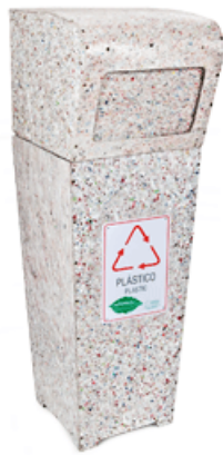
COLETOR COM TAMPA BASCULANTE 30 LITROS