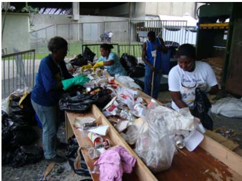
Mesa de separação

produção de uma mesa para separação de resíduos e a aquisição de uma prensa hidráulica enfardadeira conforme imagens e especificações abaixo: