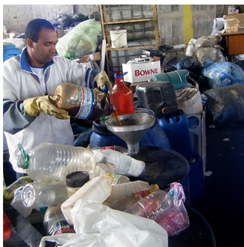
Armazenamento temporário de resíduos

As atividades de abrigo nessa área serão integradas com a recepção dos resíduos pela equipe de coleta interna e a rotina obedecerá aos critérios estabelecidos nos capítulos anteriores. A área do Depósito de Lixo será higienizada diariamente, assim como todos os recipientes e contêineres em operação de coleta e transporte interno e externo.