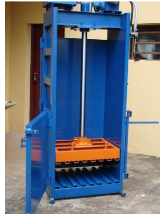
Prensa hidráulica enfardadeira de pequeno porte