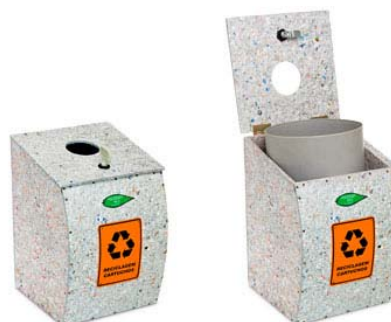
COLETOR PARA CARTUCHOS DE TINTA E TONER

TABELA COM AS ESPECIFICAÇÕES DOS COLETORES