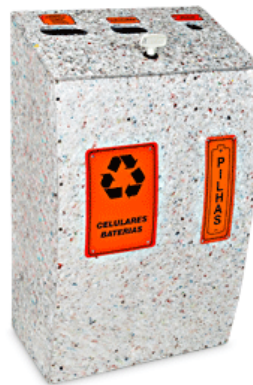
COLETOR DE PILHAS, CELULARES E BATERIAS RECARREGÁVEIS DE 60 LITROS