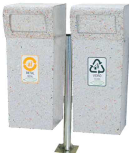
COLETOR SIMPLES DE 50 L COM TAMPA VAI E VEM

Seguindo a premissa de incentivar a reciclagem em nossos Projetos e Planos, e como sugerido pela PNRS – Política Nacional de Resíduos Sólidos, incentivamos à comercialização e o consumo de materiais recicláveis ou reciclados. Dentre as opções de coletores disponíveis, sugerimos a aquisição de lixeiras ecológicas produzidas com placas compactadas 100% recicladas, para coleta e armazenamento de resíduos a serem reciclados. A composição dos coletores tem o seguinte percentual de materiais reciclados: 75% de aparas de tubo creme dental, 75% de plástico e 25% de alumínio.