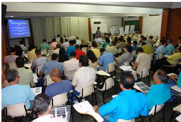
Treinamento para a Gestão de Resíduos e ações de Educação Ambiental