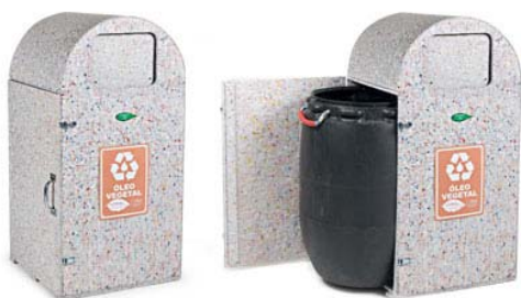
COLETOR PARA ÓLEO COMESTÍVEL TONER