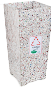
COLETOR SIMPLES SEM TAMPA 30 LITROS