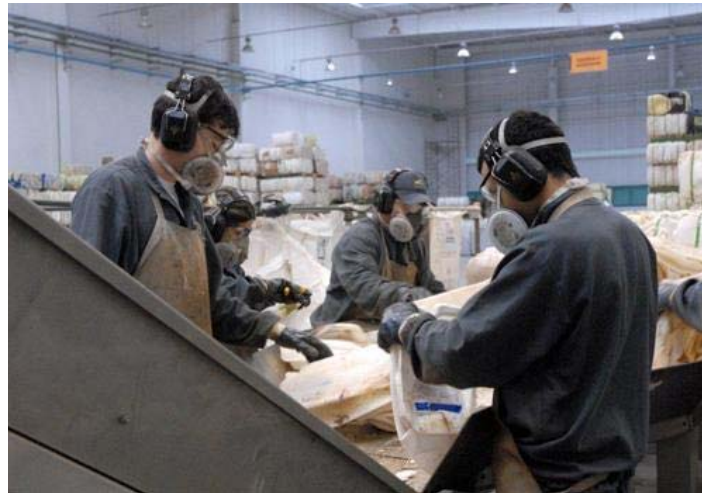
Sala de triagem e separação de resíduos (Depósito de Lixo)