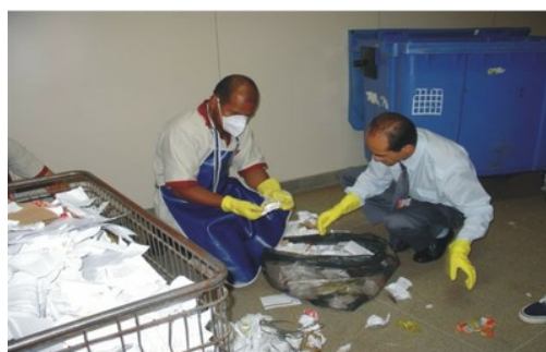
Uso de Equipamentos de proteção individual - EPI

As operações citadas envolvem risco potencial de acidente, principalmente para os profissionais que atuam nas atividades de manuseio, coleta seletiva, varrição, limpeza e transporte interno. Com o objetivo de proteger as áreas do corpo expostas ao contato com os resíduos, os integrantes da equipe devem, obrigatoriamente, usar Equipamento de Proteção Individual – EPI, conforme previsto na NR-6 do Manual de Segurança e Medicina do Trabalho, e também seguirem a NR-32, sobre Segurança e Saúde no Trabalho em Serviços de Saúde. Caberá ao empregador dispor de equipamentos de proteção que se adaptem ao tipo físico do funcionário. A adequação do peso da embalagem transportada com o biotipo do funcionário é fundamental para evitar, principalmente, carga biomecânica excessiva.